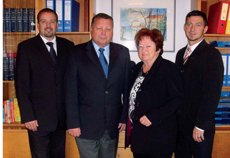
Die INKO Geschäftsführung