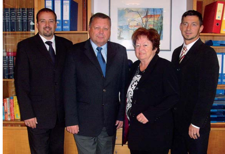
Die INKO Geschäftsführung